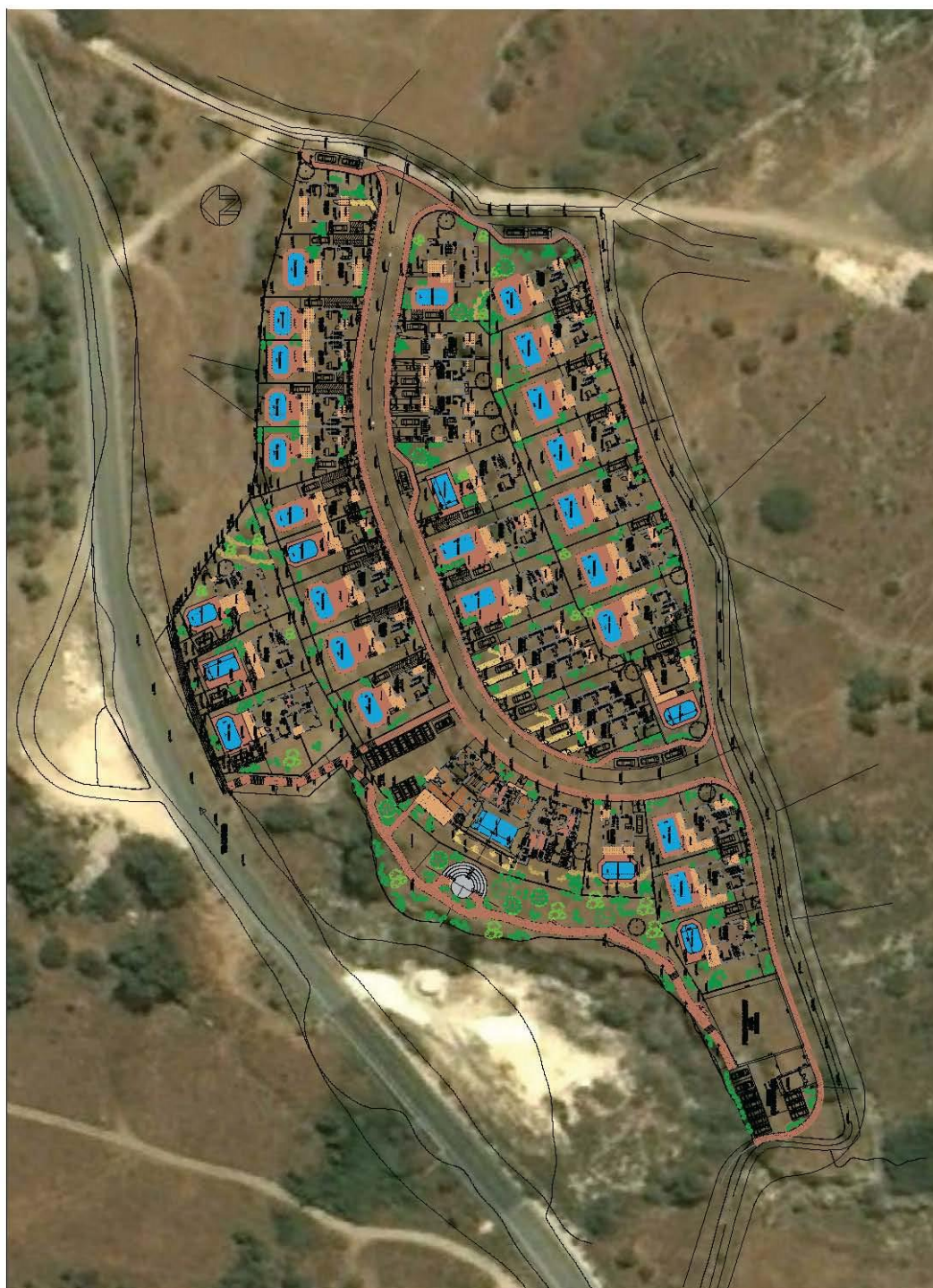
Рис.11. Планировка объектов проекта ПАНОРАМА ХИЛС