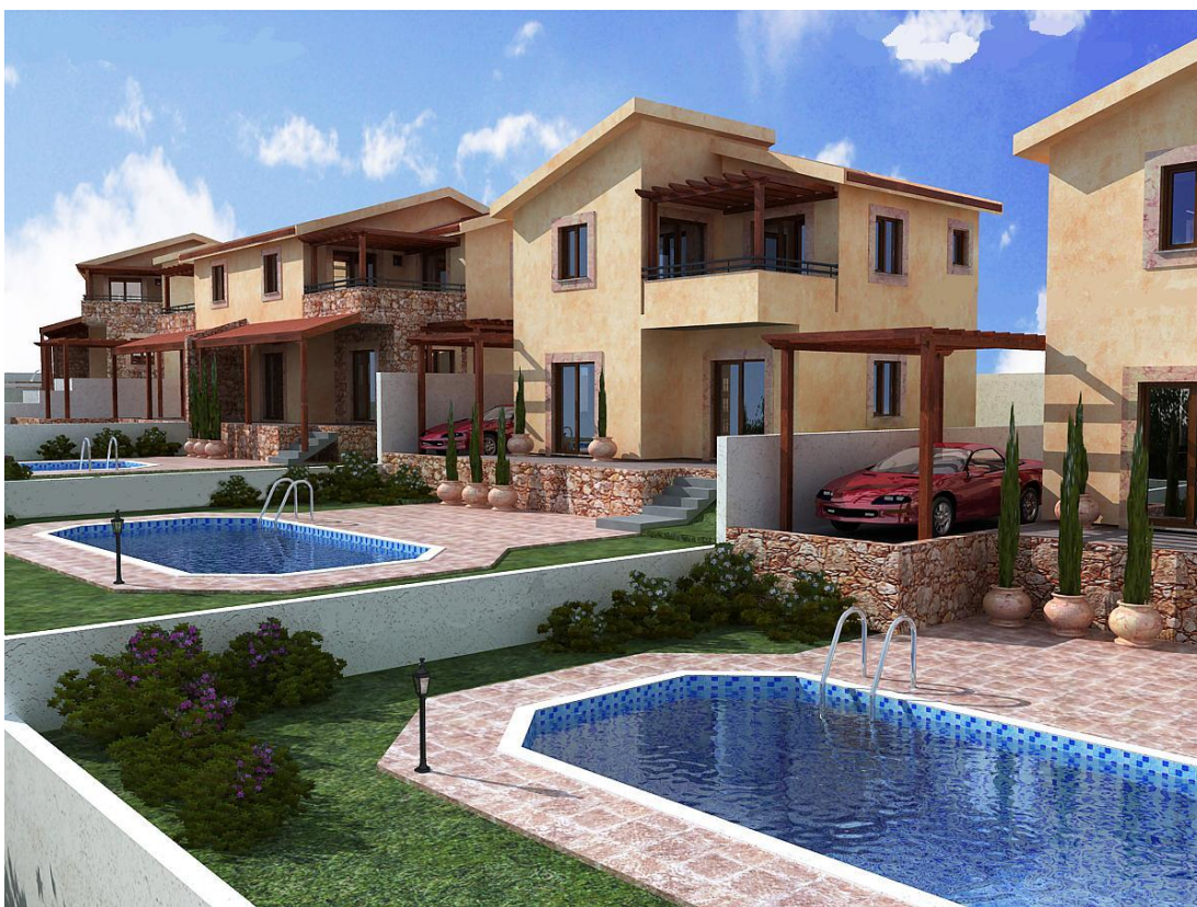
Рис. 12,13. Виды на виллы проекта ПАНОРАМА ХИЛС.